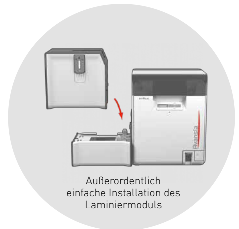
Außerordentlich einfache Installation des Laminiermoduls